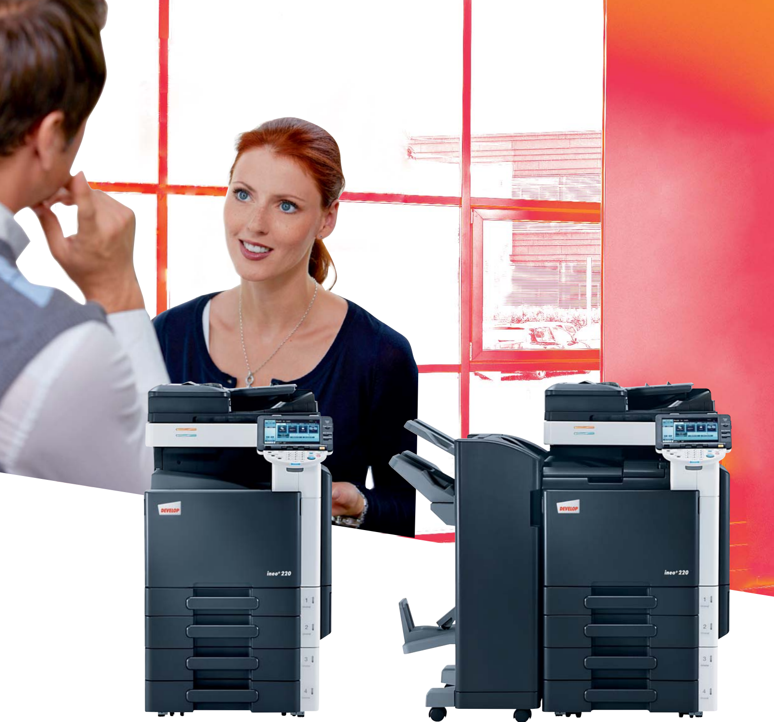
ineo+ 220 con alimentatore originali (DF-617) e mobiletto con 2 cassette carta universali da 500 fogli (PC-207)