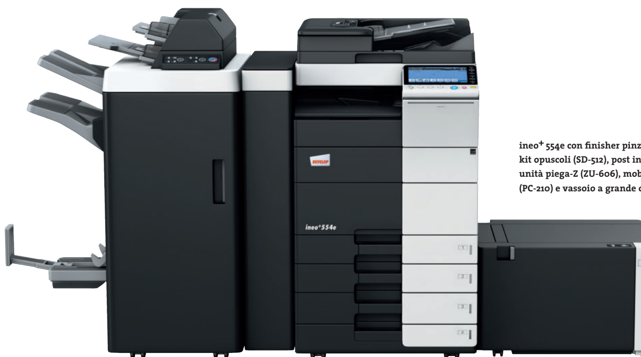
ineo+ 554e con finisher pinzatore (FS-535), kit opuscoli (SD-512), post inseritore (PI-505), unità piega-Z (ZU-606), mobiletto con 2 cassette (PC-210) e vassoio a grande capacità carta (LU-204)

Alcuni sistemi multifunzione per ufficio risultano complessi da utilizzare. ineo+ 454e/554e, viceversa, è molto semplice. Un concetto di funzionamento semplice ed intuitivo assicura una facilità d'utilizzo analoga a quella di uno smartphone o di un tablet. Il display touchscreen capacitivo da 9 pollici è dotato di funzioni note di tipo multi-touch come flick, drag&drop o pinch in&out. Grazie alla nuova struttura di navigazione del menu è possibile visualizzare le funzioni desiderate in simultanea, selezionandole con pochi clic.