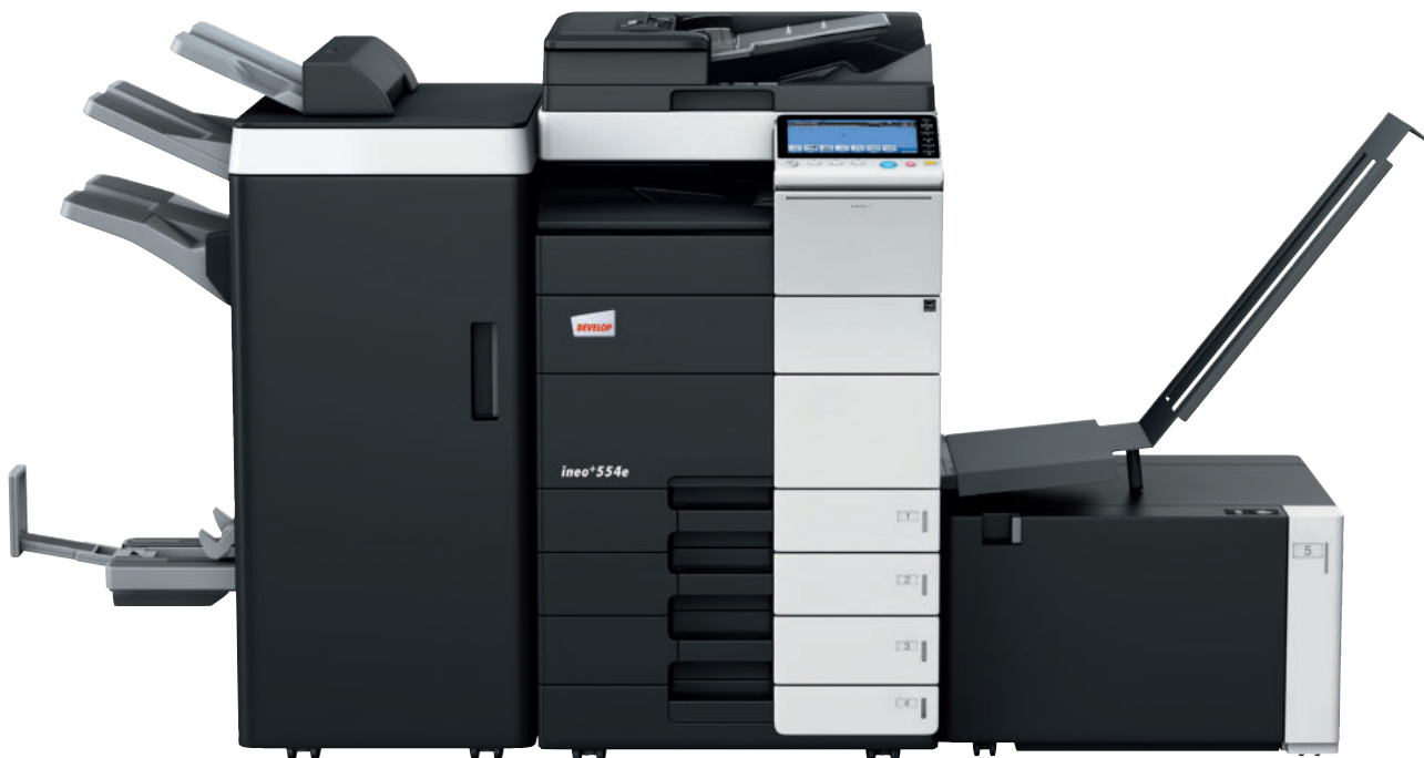
ineo+ 554e con finisher pinzatore (FS-535), kit opuscoli (SD-512), separatore lavori (JS-602), mobiletto con 2 cassette (PC-210), vassoio a grande capacità carta (LU-204) e vassoio porta-banner (BT-C1e)