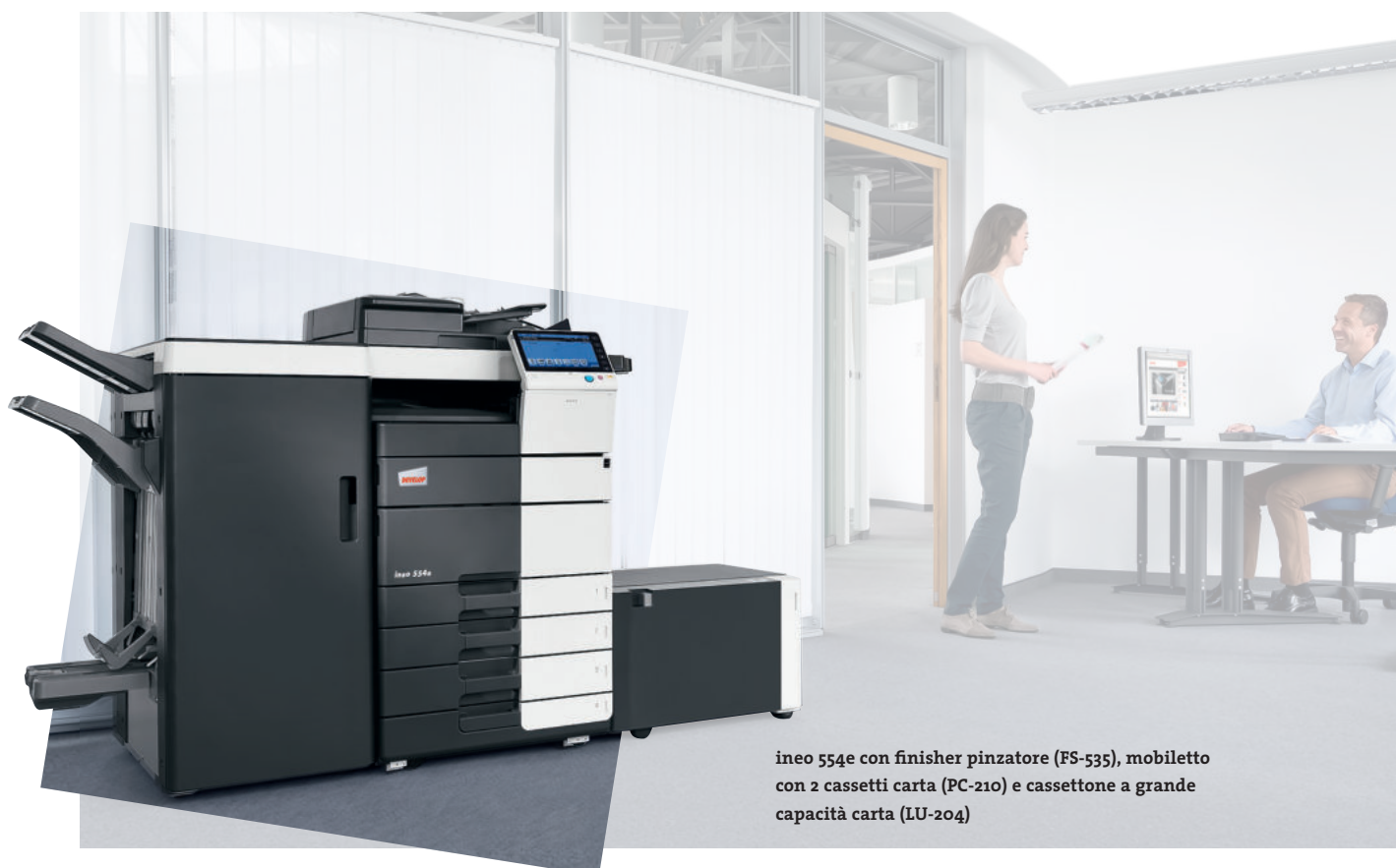
ineo 554e con finisher pinzatore (FS-535), mobiletto con 2 cassette carta (PC-210) e cassettone a grande capacità carta (LU-204)

Questi sistemi in monocromia offrono numerose funzionalità energy-saving che permettono di tagliare l'assorbimento energetico fino al 40% se comparati con i modelli precedenti. Mentre questo tipo di economia aiuta a risparmiare denaro, altre funzioni "green" consentono benefici dal punto di vista ecologico. Ciò significa che la gamma DEVELOP ineo non solo salvaguarda l'ambiente ma è in grado di incrementare le credenziali "green" di chi la utilizza.