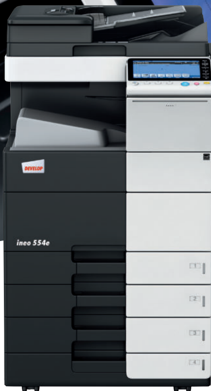
ineo 554e con mobiletto con 2 cassette carta (PC-210), piano di lavoro (WT-506) e vassoio uscita copie (OT-506)